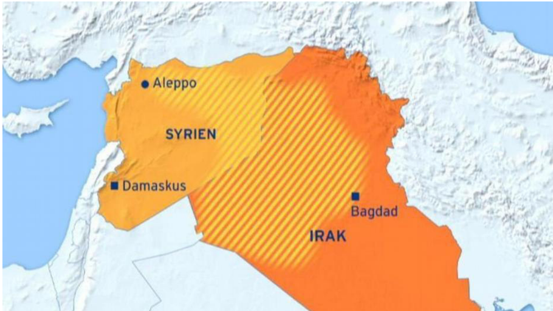
Abbildung 1: IS-Kalifat.